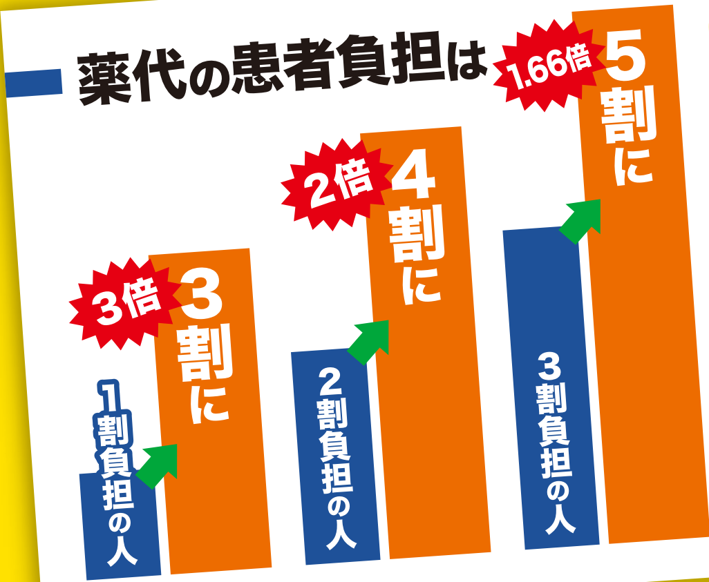
※実質的な負担割合

一方で 医療費の削減額は 約900億円で、 一人当たり に換算すると月63円の 「軽減」にすぎない。