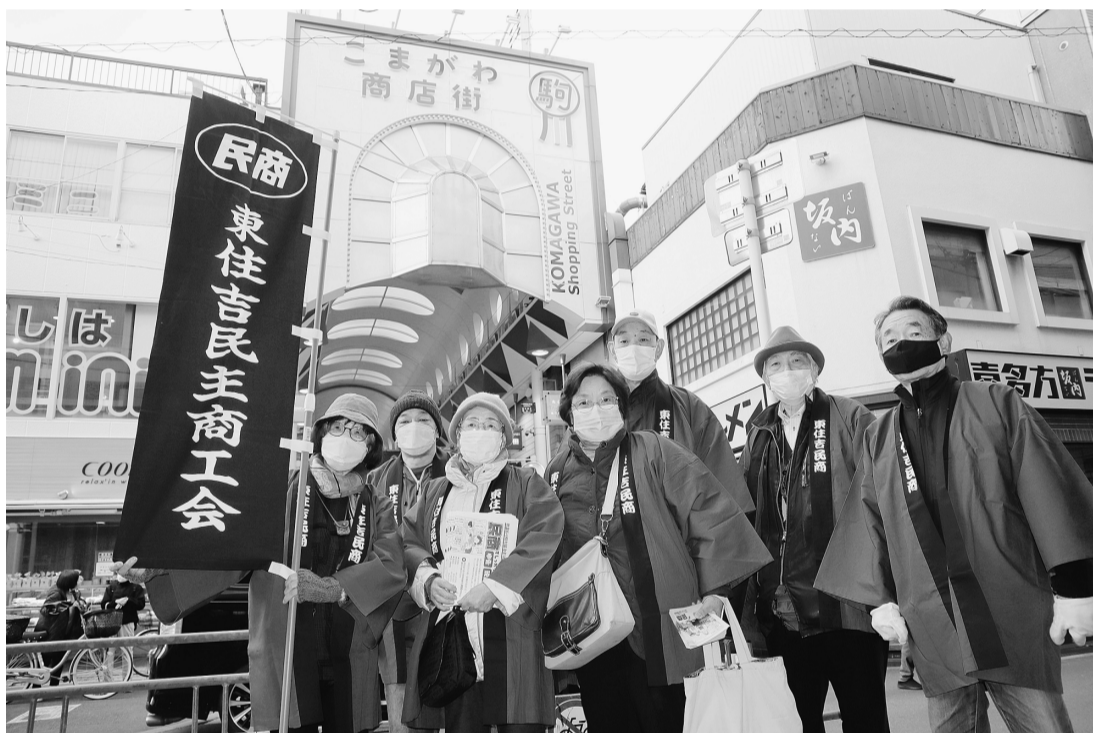
大阪・駒川商店街の業者訪問に出発する東住吉民商の役員・会員ら(22年3月6日)

商工新聞中心の活動で、地域と全国を結び、運動、組織、財政を統一的に前進させます。よく読み、紙面を紹介し合ってください。全国の英知を商売と運動に生かします。読者を増やし、商工新聞で運動の広がりをつくりたい。配達や集金への会員参加を増やし、読者に民商の催しも知ら