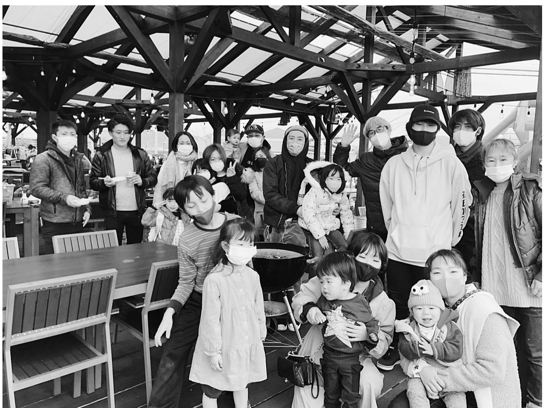
バーベキューをしながら商売やインボイス問題について交流した岐阜県青協の懇親会 (21年12月12日)

務局員を選任して機能の強化を図り、連合会組織の役割発揮を、次の任務に基づいて系統的に追求します。