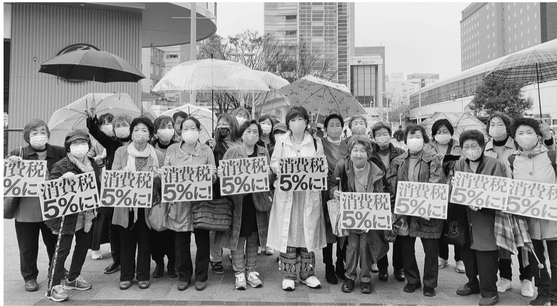
消費税が導入された4月1日に、税率5%引き下げを求めた神奈川県婦協の宣伝