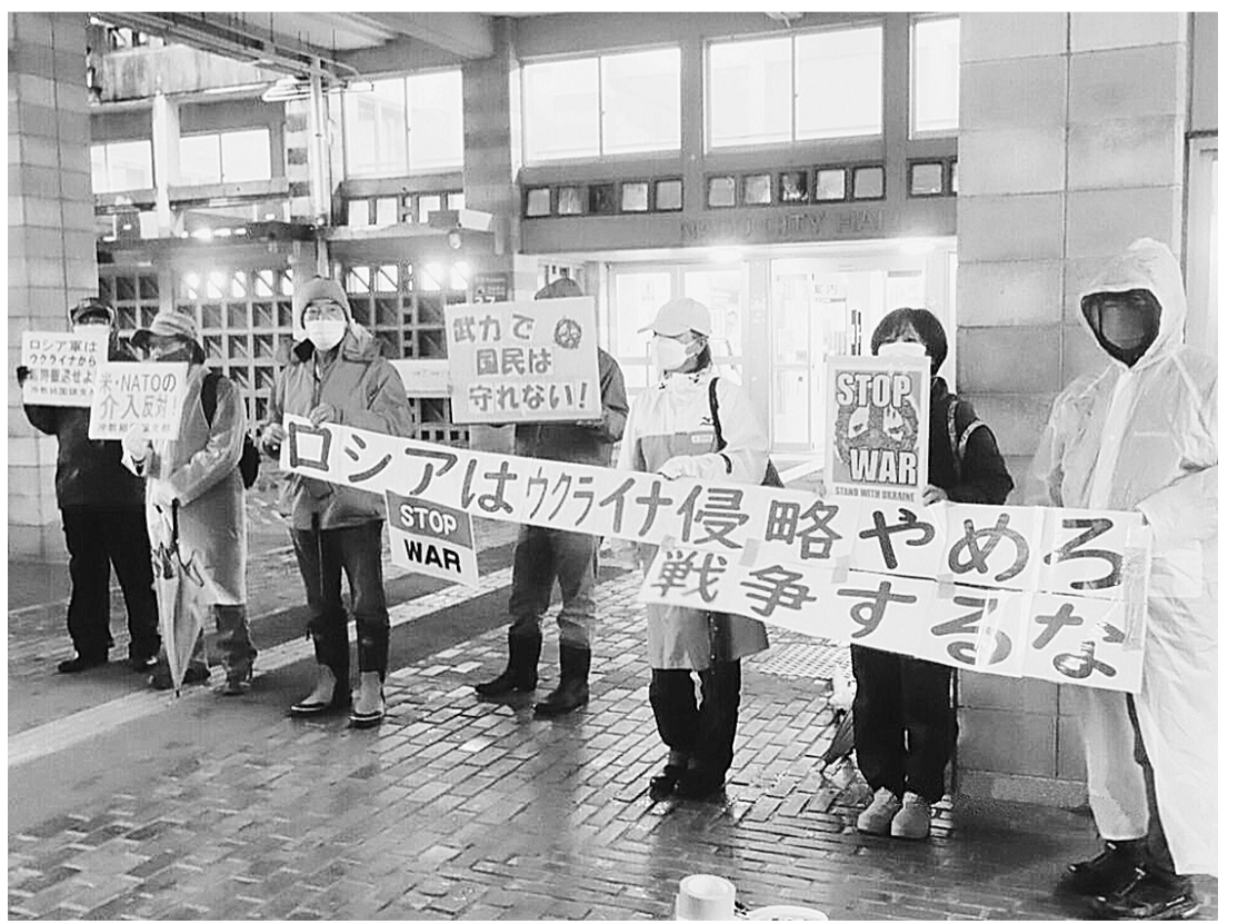
大雨の中、ロシア・プーチン政権の蛮行に抗議し、即時撤退を求める緊急集会に参加する沖縄・名護民商の役員ら(22年3月7日、名護市役所中庭)

2、希望の持てる経済社会をめざして 新自由主義に基づくルールなき資本主義を規制し、持続可能な地域循環型社会をめざす国際的な動きが強まっています。国連に加盟する193カ国が掲げた持続可能で多様性のある社会に向けた目標(SDGs)達成への取り組みもその一つです。医療の拡充や食料自給率の向上、多国籍大企業に適正課税を迫る社会的連帯も広がっています。二酸化炭素排出ゼロに向けた脱炭素や省エネと再生可能エネルギーへの転換が雇用増と経済成長に役立つことも明らかにされました。ジェンダー平等を進めた国で経済が成長していることにも注目が集まっています。