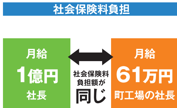
毎年引き上げられてきた健康保険料率